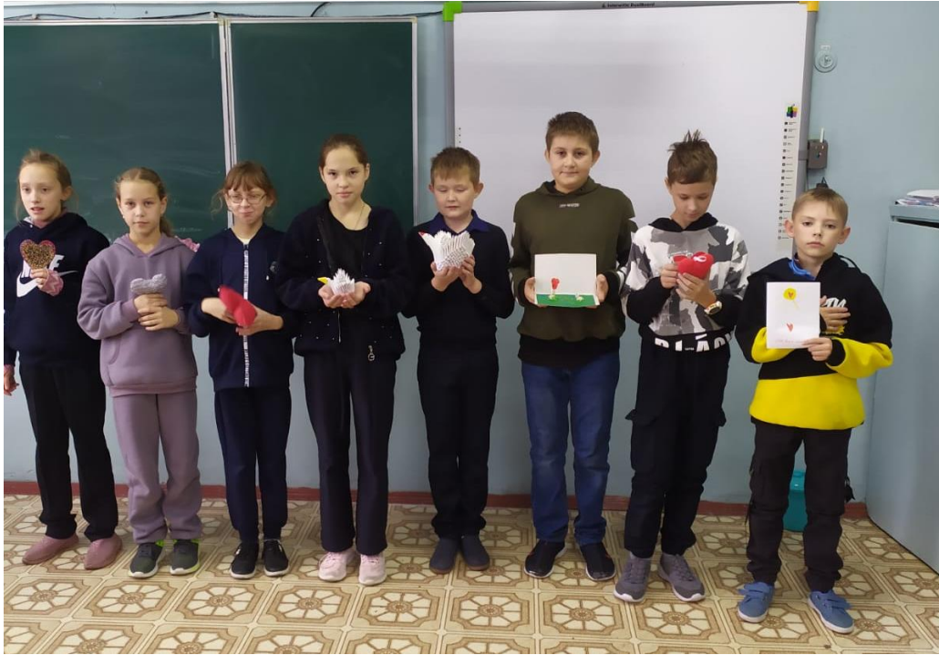
Ученики шестого класса оказали помощь в домашних делах своим бабушкам.